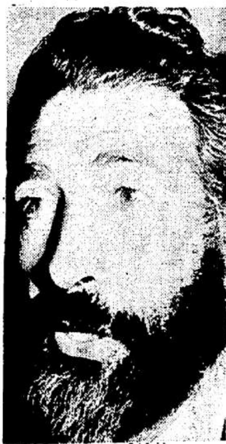
Mr. del Banco (Pontevedra)

—Ayer ha cerrado su exposición de escultura Xoan Piñeiro, que ha sido invitado a presentarla en el Ateneo de Pontevedra. Sus obras salen hoy para la capital de la provincia. —Semana optimista para los celtistas. Nuestro equipo ha ganado fuera.